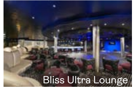
Bliss Ultra Lounge