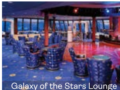
Galaxy of the Stars Lounge